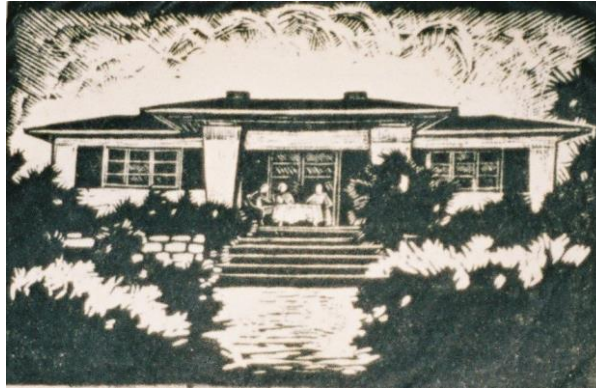
Landhaus Graf, Werder, ca. 1923, Holzschnitt

Gerhard-Graf-Gesellschaft Am Plessower See 9 A 14542 Werder www.gerhard-graf.de bals@uni-potsdam.de Tel.: 0 33 27 – 567 036 Bankverbindung: BBBank Karlsruhe, Konto-Nr. 24 29 004, BLZ 660 908 00 IBAN: DE71 6609 0800 0002 4290 04