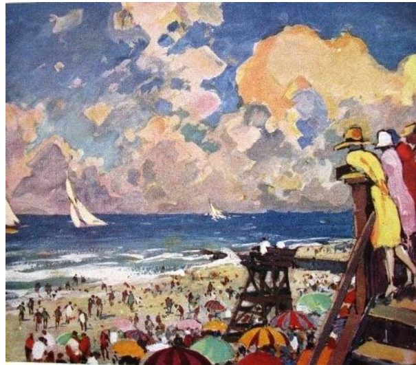
Strand am Atlantik, USA, 1927, Gouache

Sitz der Gerhard-Graf-Gesellschaft ist Werder/Havel, im früheren Landhaus und Atelier des Malers.