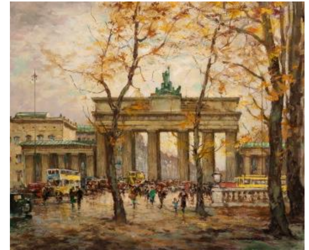
Brandenburger Tor im Herbst, Öl auf Lwd.

Sie erhalten Informationen und Hilfe zu allem, was das Werk des Malers betrifft, z. B. bei Auktionen oder Ausstellungen.