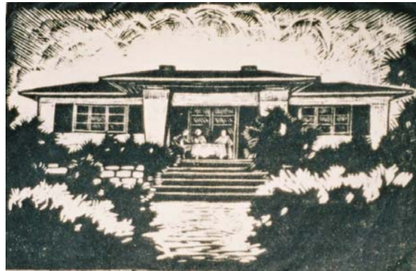
Landhaus Graf, Werder, ca. 1923, Holzschnitt

Die Gerhard-Graf-Gesellschaft bietet in dem ehemaligen Sommeratelier Gerhard Grafs am Plessower See in Werder/Havel einen Einblick in das Leben und Werk des Berliner Malers, mit zahlreichen Werken aus Privatbesitz und dem Nachlass des Künstlers. Besichtigung nach Anmeldung.