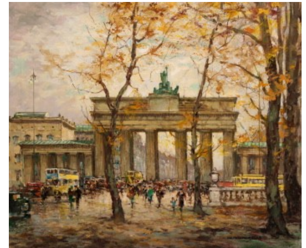
Brandenburger Tor im Herbst, Öl auf Lwd.

Sie erhalten Informationen und Hilfe zu allem, was das Werk des Malers betrifft, z. B. bei Auktionen oder Ausstellungen.