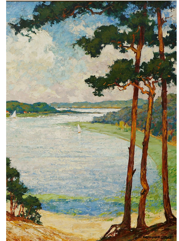
Großes Fenster an der Havel (Ausschnitt), Öl auf Lwd.